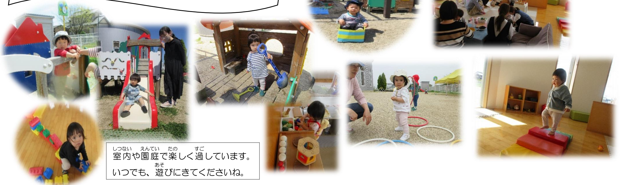
室内や園庭で楽しく過ごしています。 いつでも、遊びにきてくださいね。